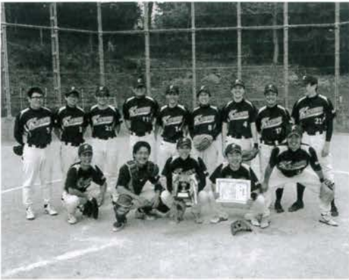
全員野球で見事に優勝!

奈良県民体育大会(県大会)は、7月2日に芝運動公園運動場(桜井市)にて行われます。