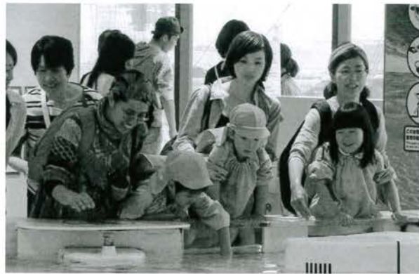
エイにさわったよ～♪

館内では、アシカやジンベイザメの泳ぐ姿を見て目をキラキラさせ、カクレクマノミや珍しい小さな生き物を見つけて、「見て見て」「すごいね、きれいね」と親子遠足を満喫しました。1日園外でおうちの人と過ごし、楽しい思い出をつくることができました。6月は日曜参観で親子クッキングを予定しています。