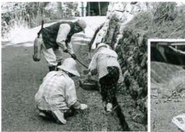
ご協力ありがとうございました!