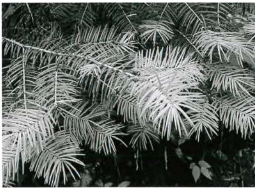
林道沿いのトガサワラはやわらかい新芽を出していました

ちょうど初夏と言うこともあって、林道上にはたくさんのおトシブミのゆりかごも見つけました。おトシブミはおトシブミ科の甲虫のなかまの総称です。切り取った葉っぱを筒状にクルクルと巻いて、その中に卵を産んで落とします。その葉っぱの包みが、その昔、恋文を巻いて相手の通り道に他の人に気づかれないように落として渡した様子からおトシブミ(落とし文)と付けられました。