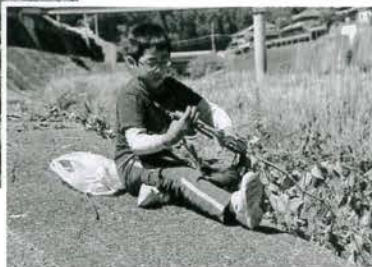
子どもたちも一生懸命掃除しました