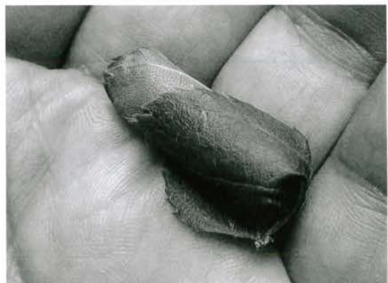
おトシブミのゆりかご

幼虫は、外敵に見つかりにくい葉っぱのゆりかごの中で葉っぱを食べて成長します。虫にも親の愛ですね。こんな発見も車に乗って移動していたらできなかっただろうと思います。熱中症には気を付けて、たまにはいつも車で通っている路を歩いて見るのも面白いかもしれませんよ。