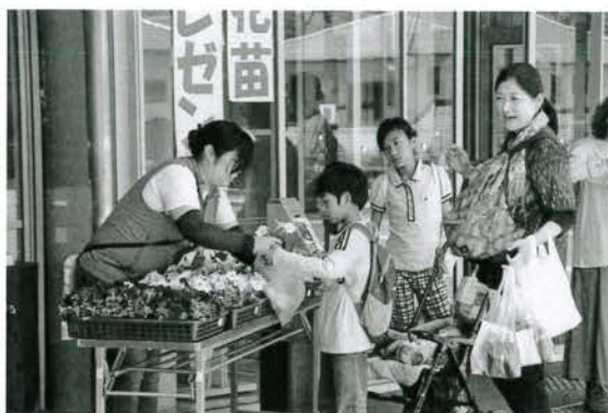
森守募金へのたくさんのご協力ありがとうございました！