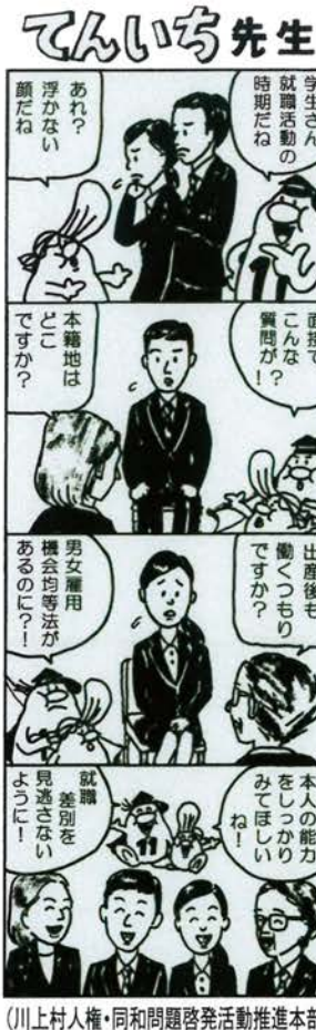
(川上村人権・同和問題啓発活動推進本部)