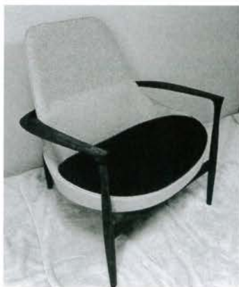
自主制作の安楽椅子