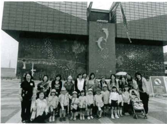
海遊館に着いたよ～

5月9日、親子遠足で海遊館に行ってきました。この日を楽しみにしていた子どもたちは、朝からとびきりの笑顔で集合し、元気に観光バスに乗り込みました。行き道中では、母の日が近いので、一人ひとりがお母さんに歌のプレゼントをして、盛り上がりました。あいにくの雨模様だったので、お弁当は室内でしたが、お母さんと一緒にうれしそうにお話しながら食べたり、自分で選んだおやつをお友達と見せ合いっこする姿が見られました。