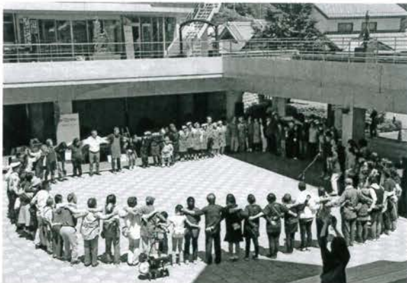
出演者全員で毎年恒例の円陣を組みました！

このイベントは、「吉野おはなしのしネットワークのほほん」が中心となって、吉野郡の各団体協力のもと行われており、年々「吉野の絆」が強くなってきているのが実感できます。