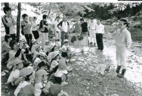
しっかり話を聞く子どもたち