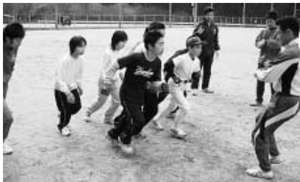
休日を利用して練習に励む選手たち。(川上健民グラウンド)