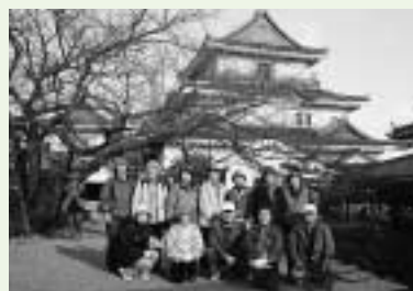
海に到着後、市の象徴である和歌山城にも立ち寄りしました。