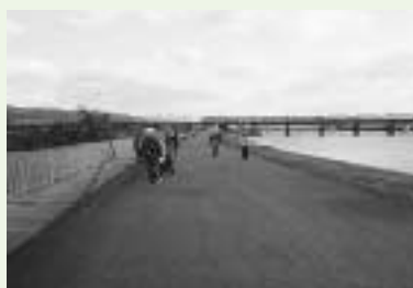
広い河川敷沿の道を歩く。海は真近。(和歌山市)

吉野町に入る2月より参加しました。都合10回あるきましたが、南国栖の清水橋付近のじじがわら、ばばがわらは小さいころよく泳いだ場所だったのですが、川幅が狭くなっていて驚きました。海までの道中、車ではしっているだけでは分からない多くのことが発見できて非常に勉強になりました。