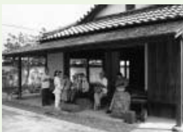
真夏の日差しをさけて、休けい。 (和歌山県那賀町)

我が村から流れを発しているとは言え、紀の川の雄大さはどうでしょう。ふくいくと流れて、大河への発展振りは感激です。寒中の川での紙すき作業や地域の歴史を守っている多くの方と出会い、私の視野も広まったように思います。