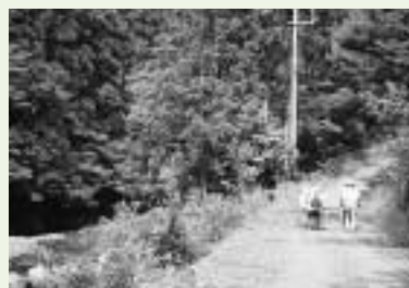
海までの長い道のりを歩きはじめる（三之公付近）

私は第6回目の吉野町宮滝遺跡から参加しました。自動車では何気なしに走っている道筋には、いわれのある場所がたくさんあることを知り嬉しくなりました。あれから車を運転しながら、その近くを通り過ぎるとき、歩いたときのことを思い出しています。