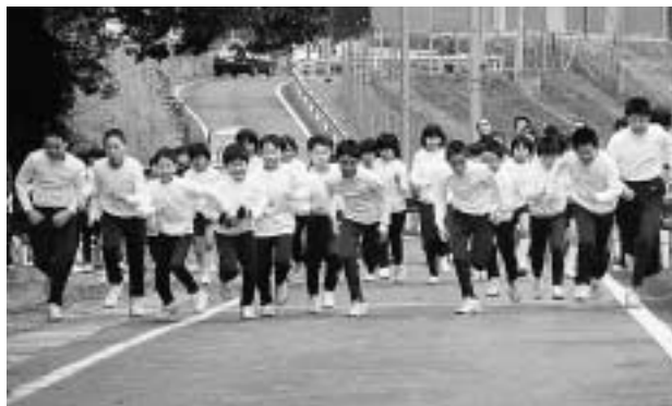
2月2日に行なわれた小学校のマラソン大会。好記録が続出していました。

この駅伝大会は今年から始まる大会で、第1回大会は北葛城郡河合町にある馬見丘陵公園で行われます。市町村対抗とあって、各市町村から男女混合の1チームが参加。男子が5区間9・25km、女子が4区間7・25km、合わせて9区間16・5kmをたすきでつないで行きます。本村では川上小学校の5・6年生12名が参加の予定です。子どもたちは、3月の大会に向けて練習していますが、放課後や日曜日などのプライベートの時間を割いて練習に余念がありません。もし、練習を見かけましたら、ご声援よろしく願います。