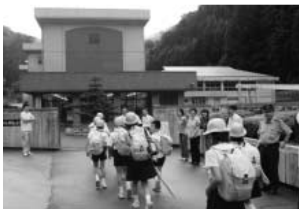
事件や事故に巻き込まれないように注意してください