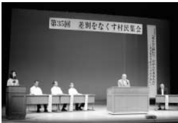
差別をなくす村民集会の開会行事