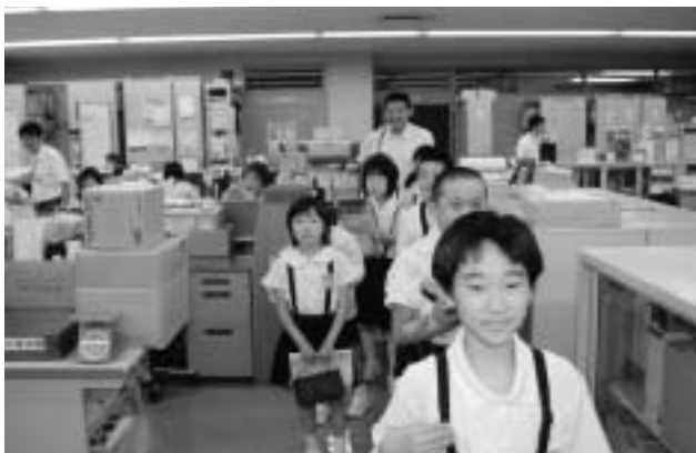
みんなで役場見学

「役場で一番大切な仕事は何？」 「役場で一番難しい仕事は何？」 など、返答に苦慮する質問が相次ぎ、案内した職員はタジタジになっていました。