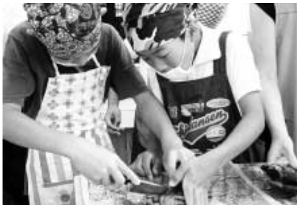
みんなで料理講習会

真鯛の刺身・カルパッチョ・潮汁、タコの花ふら、メバルの煮付け、グレのイタリア風プレート焼き