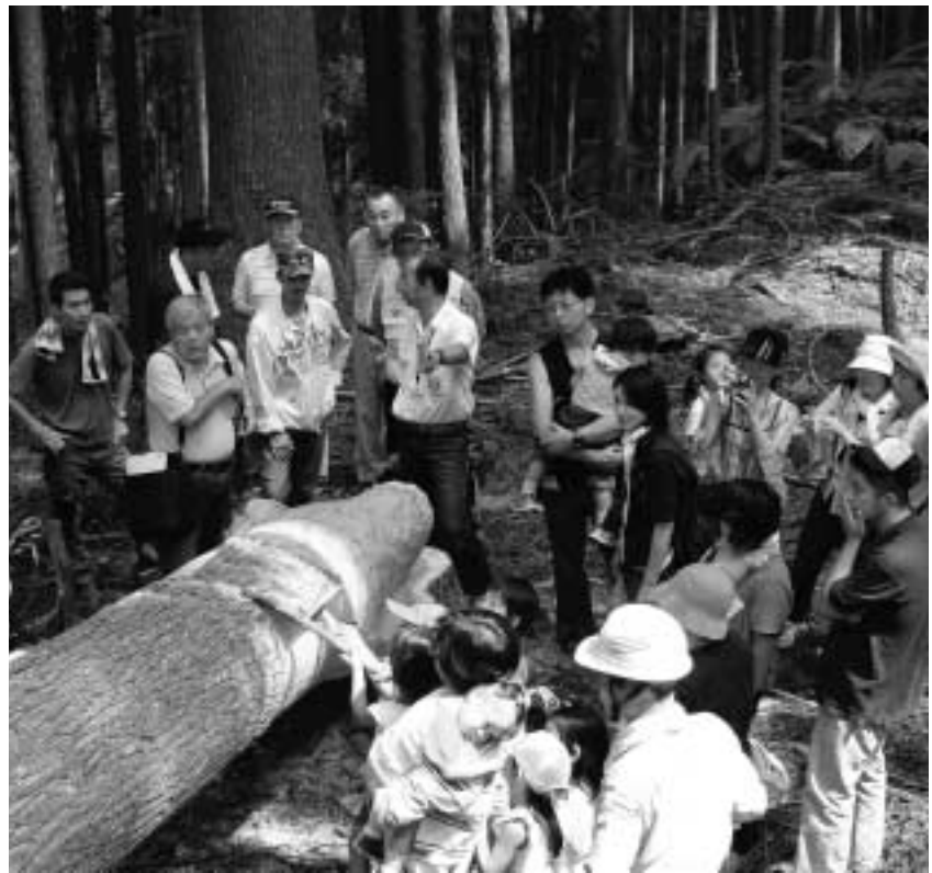
吉野杉伐採見学ツアー

最近の原油高や環境問題などが影響し、若干ではありますが、国産材の使用が増加傾向に転じています。 これを林業不況脱出の転機とするため、「第2回まるごと吉野杉フェア」を開催しました。 吉野杉の良さを改めて広く知っていただき、川上産材の付加価値を高めて、販売促進につなげることをねらいとしています。