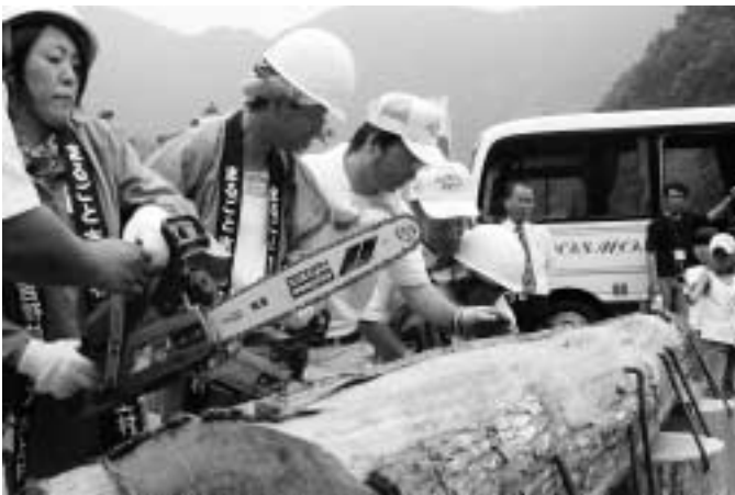
丸太カットにより開会

「第2回まるごと吉野杉フェア」は「川上の材P R運営委員会」の主催で7月29日に林業総合センター（西河）で実施されました。南本会長の挨拶の後、参加者によるテープカットならぬ、丸太カットにより開会しました。 「まるごと吉野杉フェア」では、実際に切り倒される様子を見学する「吉野杉伐採見学ツアー」を企画しました。ツアーには、吉野杉を使った住宅建築を考えている工務店や建築を考えている家族など、村外から約80名が参加しました。