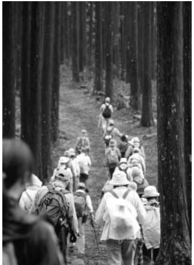
杉・ヒノキの香り漂う歴史の道