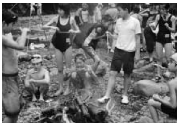
150匹、全部食べちゃった

挨拶の後、「和歌山市民の森」のある紀ノ川（吉野川）の源流・三之公（入之波）へ移動しました。三之公では、両校児童がいっしょに昼食をとり、「森と水の源流館」の辻谷館長から「森は木があるだけじゃない。森には動物もいれば、川には魚がいる。ほかに栗やイチ