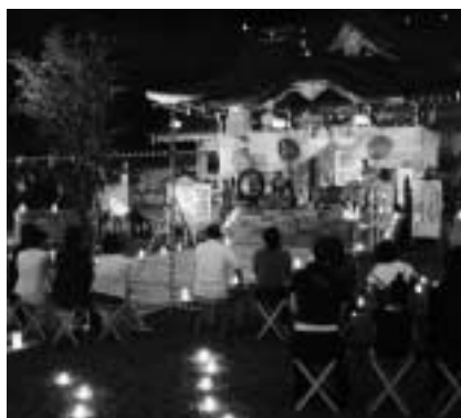
ろうそくが幻想的でキレイでした

「大地母神ばちやまま」のシンセサイザー、オカリナ、芦笛、打楽器などによる奉納が行われました。「大地母神ばちやまま」は、水を護ることを演奏に込めているそうです。