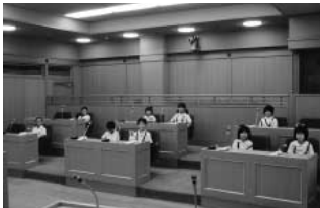
議場に集まったちびっ子議員さん