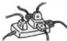
タコ足配線をしない