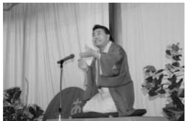
笑って、構えたカメラが震えました