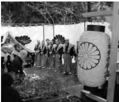
鐘兜を拝み「御朝拜の儀」

「朝拜式」は悲運の最期をとげた自天王をしのび、三之公で毎年2月5日に行われていた新年の拝賀の儀式にしろ、生前の武具を御神体として崇める式典です。