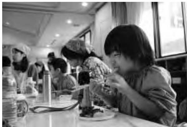
モグモグ、いっぱい食べました

食育は、一人一人が健全な食生活に必要な知識や判断力を身につけ、それを普段の生活に取り入れられるよう目指しています。最近では栄養の偏りや食習慣の乱れに伴う肥満や生活習慣病の増加、過度の痩身などが問題となつていきます。しかし、食に関する知識や判断力を身につけることで、これらの問題の改善に役立つと思われまます。皆さんもすこし食生活を直してみませんか？