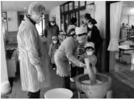
みんな交代でヨイショ!

やまぶき保育園（宮の平）では、1月25日に行われた耐寒マラソンの後、昨年10月に園庭で収穫したもち米を使用して、みんなでお餅をつきました。子どもたちは、つきたてのお餅にきな粉や醤油などをつけて、口いっぱい頬張っていました。