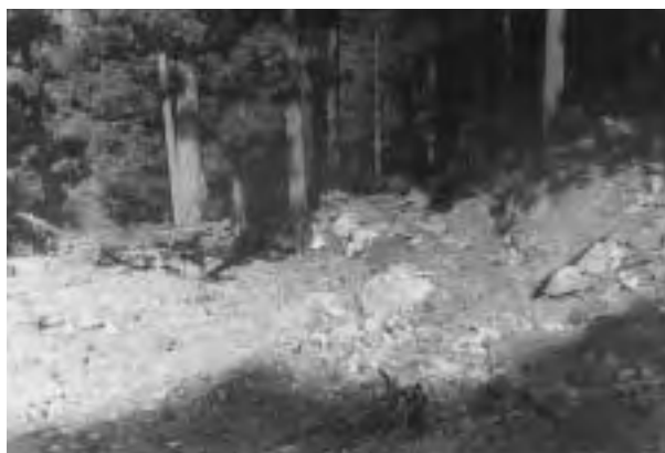
村道上谷線が崩土のため、まるで河原

Cさん 台風とは関係ないけど、昔ね北山の西原から川上まで歩いて嫁入り来たって言うんやからな。今思うたらビックリするわな。そんな時代でしたからな。だ