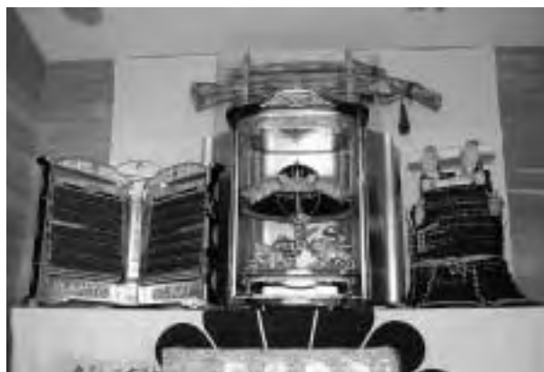
公開された宝物殿に納められている武具

式典には袴や羽織袴を身にまとった各大字の代表者などのほか、村内や他府県などからも多くの観衆が集まり、厳かな緊張感に包まれるなか、肅々と営まれました。まずは、朝拜殿にて「支度」が行われました。参列者たちは式次第などの説明を受け、おちつき雑煮と呼ばれる膳をいただき、自天王神社参拝に向かいました。神社では玉串奉奠などの「自天王神社前の儀」を行い、いよいよ「御朝拜の儀」が始まります。宝物殿の扉が開かれ、賀詞奏上などが行われました。