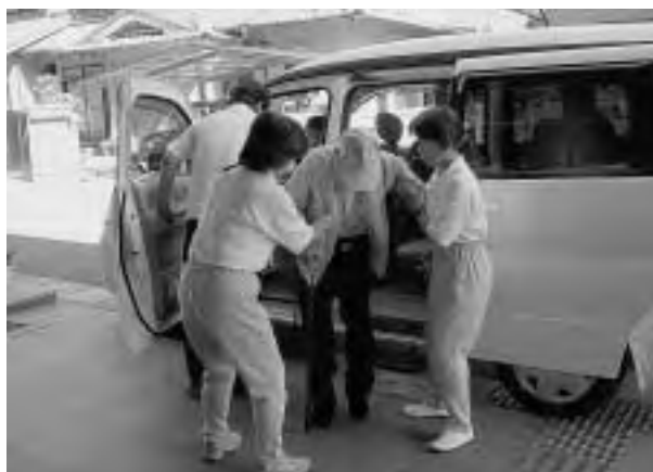
週3回のデイサービス実施

少しでも村内の介護環境向上のため、平成16年からはデイサービス事業も展開をはじめ、介護が必要となっても安心して住むことができるように努めています。要介護認定は一人では出来ない