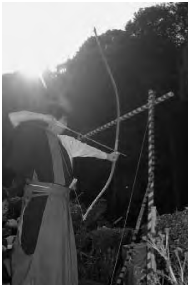
狙いを定め、緊張の瞬間

「むかし、諸国に悪魔、怪物がはびこり、疫病が流行し、平和であったこの山里もその影響に脅か