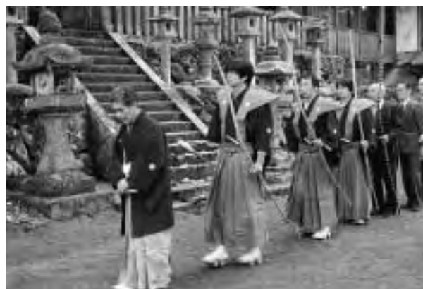
烏川神社から運川寺へ向かう一行

されていたんだと。ある時、弓の名人・東弥惣 ひがしやそう が神力を借りて、諸悪の根元であった悪魔の化身を見出し、弓矢で見事これを退治したそうなの。」