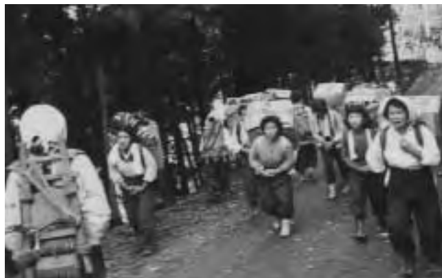
当時はみんな歩いて運んだそうです

Dさん そんなんで長い間、河原が道代わりで、車は河原を走つてましてん。私の叔父さんになるんかな。大阪で亡くなつて、連れて帰つた時、川をズツと走るから、運転手さんも泣くような顔してましたわ。