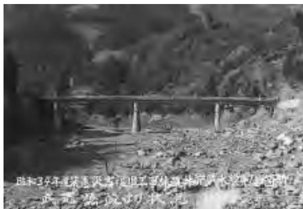
昭和34年伊勢湾台風後田原町外道井光線武光橋の状況

2軒は半壊やったけど、屋根があったから寝れたんや。仮設住宅は、すぐに建てられへんだんや。資材を運ぶ道路もあらへ