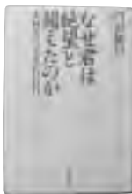
『なぜ君は絶望と闘えたのか -本村 洋の3300日-』 門田隆将 著

判決、死刑一。妻子を殺された哀しみの中、司法に敢然と挑んだ青年と彼を支えた人々たち。光市母子殺害事件遺族の苦闘を、圧倒的な事実と秘話で綴る感動の記録をまとめています。