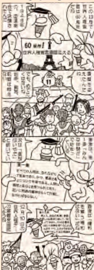
(川上村人権・同和問題啓発活動推進本部)