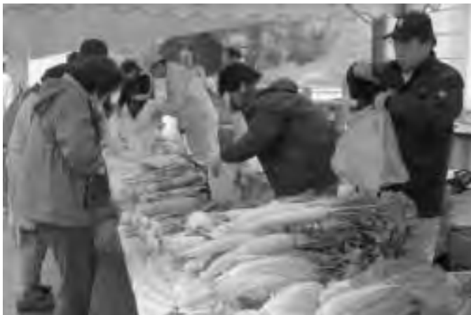
農協前で行われた野菜の即売会