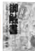
『江戸の御触書 -生類憐みの令から人相書まで-』 楠木誠一郎 著

裁判員候補者名簿に名前が載ったら、裁判所からの「呼び出し状」が自宅に届いたら…。様々な疑問や不安にQ & Aで答えています。日本の刑事裁判制度の変貌や、裁判員制度の歴史、主要国での国民の司法参加制度なども解説しています。