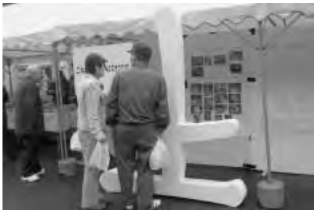
上 NPO法人「芳水塾」の展示ブース 左 フィナーレを飾る恒例の「もちまき」

駐在所前には、NPO法人「芳水塾」のブースが設けられ、鑑掛（大滝）に刻まれている磨崖碑 まがひ 「土倉翁造林頌徳記念」の文字で