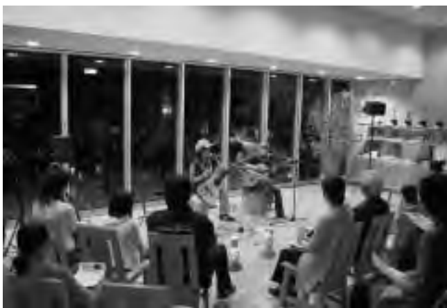
心癒される「森の演奏会」

2日には「森の演奏会」として、Guitar Duo NANA-IROによるギターコンサートが行われました。Guitar Duo NANA-IROは染色家としても活動する二人組で、心の奥に響くようなギターの音色が匠の聚に奏でられていました。