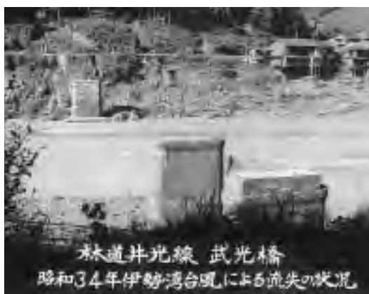
林道井光線 武光橋 昭和34年伊勢湾台風による流失の状況