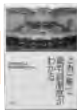
『これ一冊で 裁判員制度がわかる』 読売新聞社会部裁判員制度取材班 著

判決、死刑一。妻子を殺された哀しみの中、司法に敢然と挑んだ青年と彼を支えた人々たち。光市母子殺害事件遺族の苦闘を、圧倒的な事実と秘話で綴る感動の記録をまとめています。