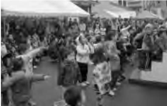
ちびっ子に大人気のアンパンマンがやって来ました!!