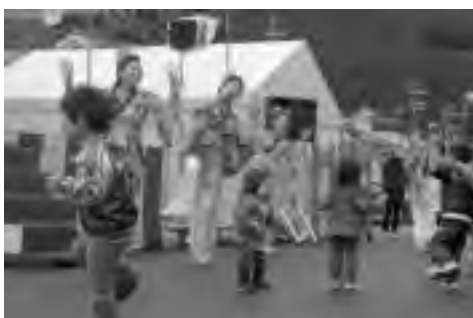
ポンプ☆キンによるヨサコイソーラン