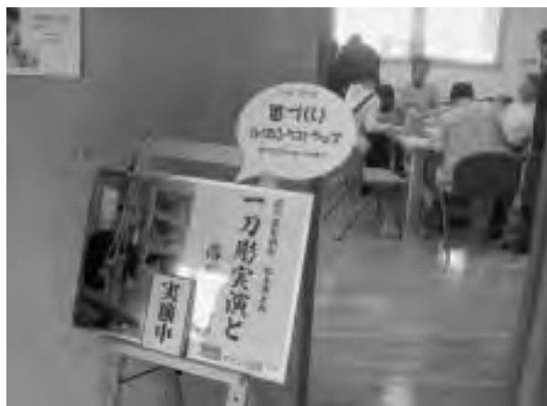
一刀彫実演と落款の制作

はありますが、今年2月に川上村響会「龍幻」が誕生しました。しかし、どうやって練習すればいいのやら・・・指導者のいない中、手探りで練習が始まりました。