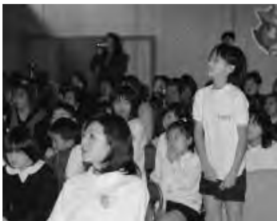
発表後、評価や感想が述べられました