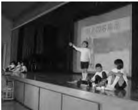
3年生「川上ちびっ子たんけんたい」