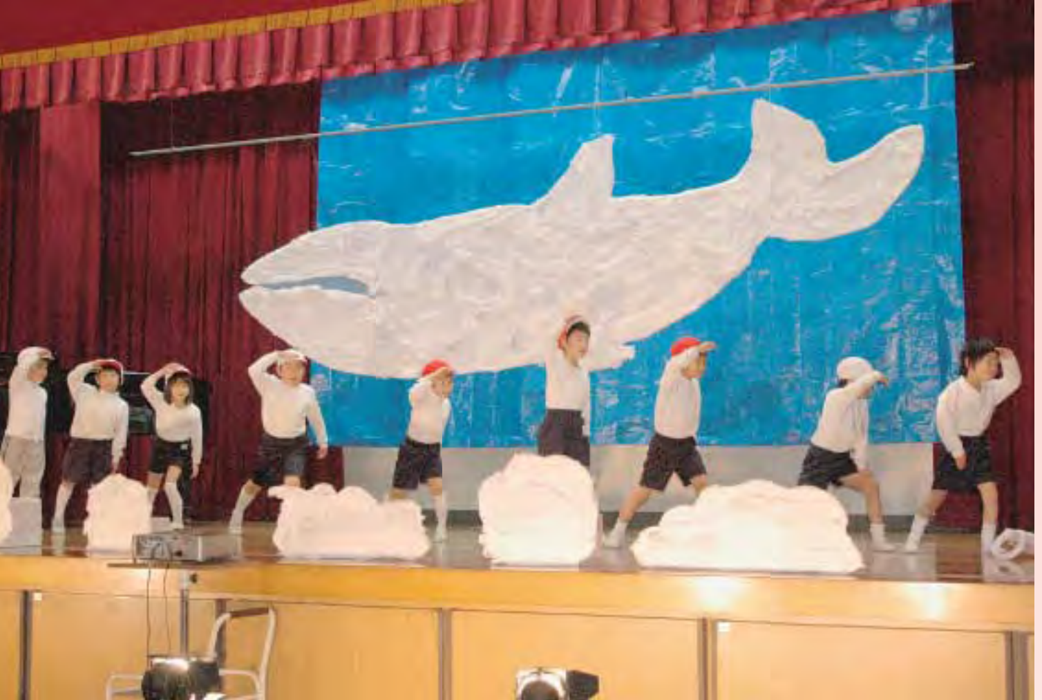
※表紙写真は1年生「くじらぐも」