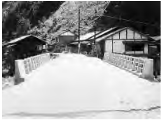
台風前の人知方面（高原土場から臨む）

かったねって思ったんや。初めは助かって良かったと思っただけ、ちょっと間経つと、何もないやろ。着替えすらあれへんだ。ほんで、あの時の救援物資はよう忘れへんわ。文句言うて悪いけど、雑巾にしゃなアカンよ。うたら罰が当たるけどな、もうちょっとエエ物くれたら良かったのになと思っただわ。昔の救援物資は今の救援物資とは違ったんや。