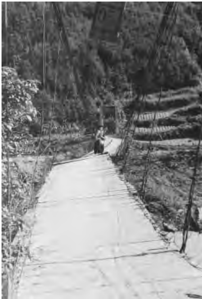
白屋へ架かる吊り橋・平和橋

吉野川沿いに吉野建て家屋の並ぶ地域。台風から一晩明けて残された橋は、傾き危険な状態の吊り橋だけ。それが当面、人々の往来に欠かせない主要な橋となったそうです。