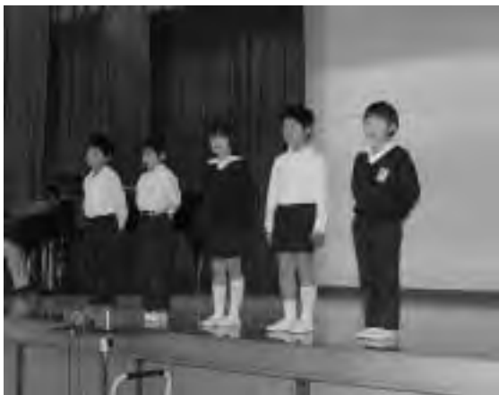
2年生「なつかしのメロディ」