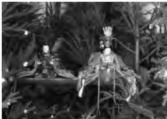
吉野杉雛には五穀豊穡を願う餅花も

お正月はなぜ、おめでたいのか。日本民俗学の立場から春夏秋冬の季節の行事の由来をひもとく、そこに込められた自然と人のかかわり方、季節に寄り添って暮らす知恵が書かれています。