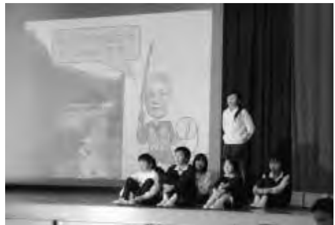
5年生・6年生「さがそう 学ぼう 川上名人！」

川上村の自然について発表しました。歴史の証人と呼ばれる川上村最古の人工林（下多古村有林）、水源地の森（三之公原生林）にある生きた化石・トガサワラ（国指定重要文化財）などを取り上げるだけでなく、見落とされることが多い、足もとの小さな植物や昆虫にも視点を向け、掘り下げた発表が行われました。