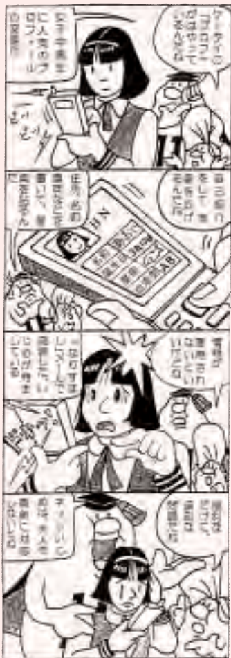
(川上村人権・同和問題啓発活動推進本部)