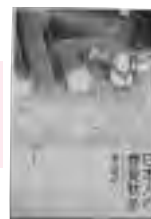
『日本人の春夏秋冬』

東大寺には、貴重で見ておくべき文化遺産がいたるところに点在しています。東大寺のどこがすごいのかのポイントをわかりやすく解説・図説したガイドブックです。