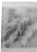
『川上村民俗調査報告書 上巻』