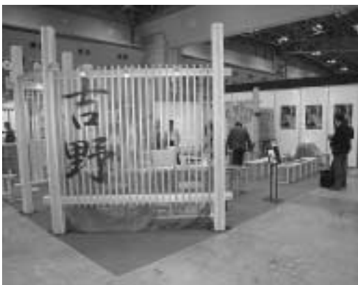
川上の材PR運営委員会の出展ブース

このイベントは、北は北海道から南は九州の全国各地の木材産地や海外からも出展される住宅・建築関連専門展示会で、約9万人が訪れた大規模な催しでした。本村からは高級品である吉野杉・