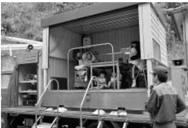
震度7は、じっとしていることが困難なほどの揺れ

地震が発生した場合に、あわてずに身を守るなど適切な行動をとるためには日ごろからの訓練が必要で