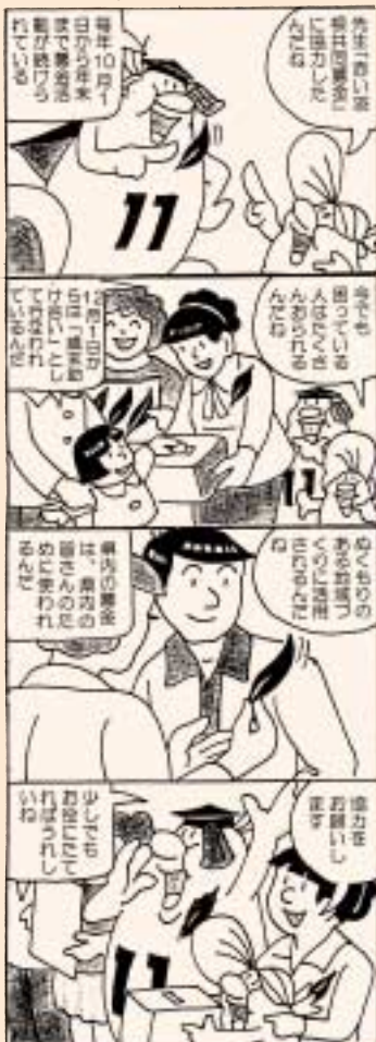
(川上村人権・同和問題啓発活動推進本部)