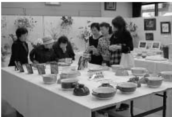
陶芸教室などの力作が並べられました

シンケンジャー・ショーではステージにかぶりつくようにちびっ子が集まり、山幸彦まつり終了後に行われたシンケンジャーとの記念撮影にも大勢の親子が集まっていました。