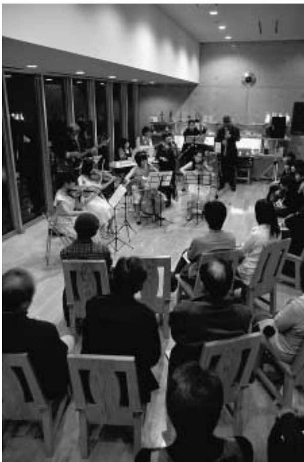
ハーモニーを楽しむ聴衆

また、最後の演奏曲となった「ムーンライトセレナーデ」では、親と子ほどの年齢差がある両グループの世代を超えたセッションで素晴らしい音楽が奏でられました。