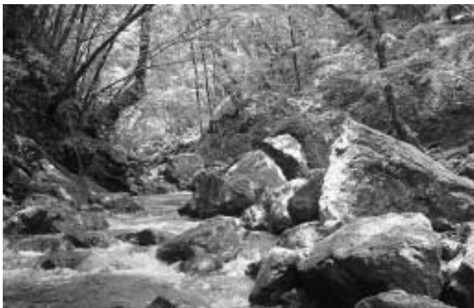
いのちの水を育む吉野川（紀の川）の源流