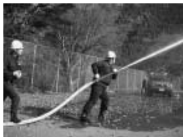
冬季は空気が乾燥し、火災が発生しやすくなっています。火の元には十分ご注意ください。

これは火災などに備え、各分団の連携を確認したものです。消防団では各地域で同じような合同訓練を行い、もしもの災害に備えています。