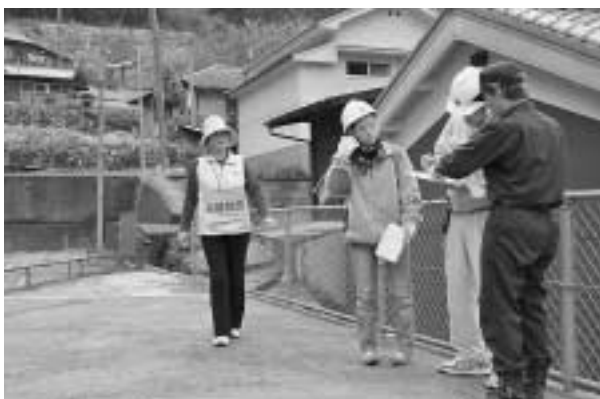
上 避難完了後、危険な地域などについて再点検 下 避難が完了したか確認しながら実施

この訓練では、自主防災組織で定めた避難所へ消防団員や役場職員の誘導により避難を行いました。この的確な避難誘導と住民の迅速な行動により、早期の避難が完了することができました。