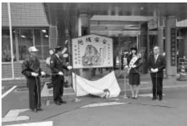
来年の干支「虎」が飾られました