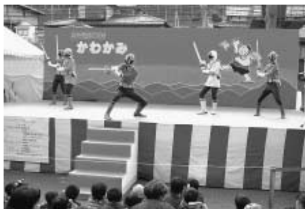
ちびっ子に大人気「侍戦隊シンケンジャー」もやってきた！

社会福祉協議会では、災害時の炊き出し訓練を兼ねた豚汁の販売が行われ、商工会や建設業組合などでも物産やバザーを行っていました。