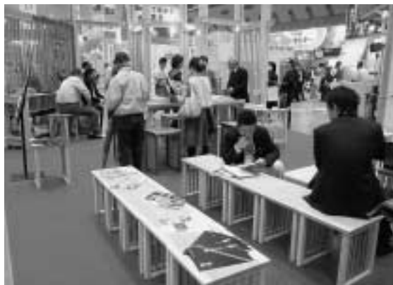
多くの方が訪れ、本物に触れていただきました