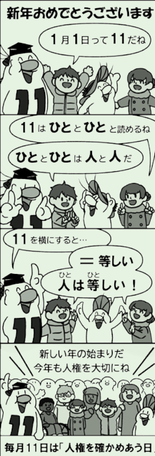
(川上村人権・同和問題啓発活動推進本部)