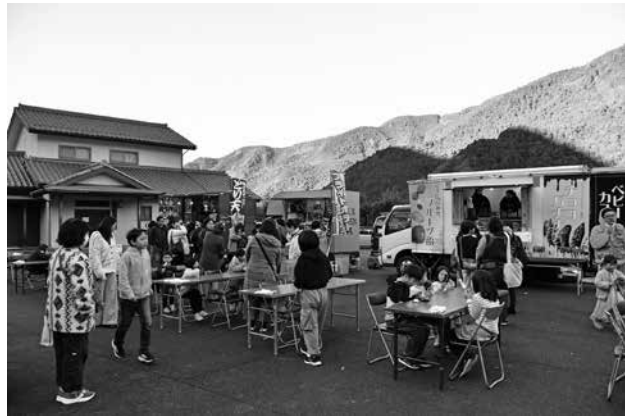
いい匂い～どれも美味しそう！

今回、ホールでは「アンサンブル・レネット」の皆さんによるコンサートが行われました。