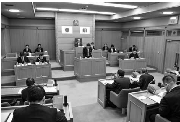
議案の説明を行う総務税務課長