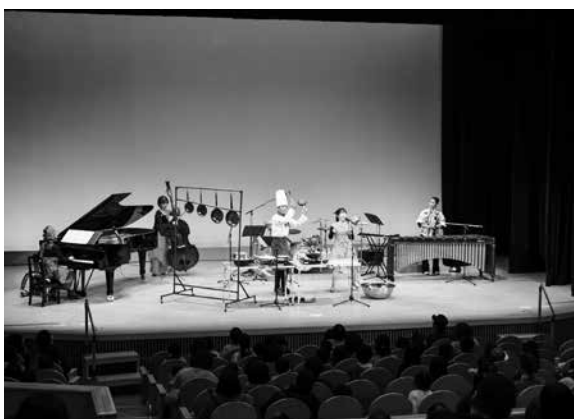
台所用品を使った演奏にみんな釘付け！

普段から楽器に触れる機会のある 子どもたちも、そうではない子 どもたちも、今回、このおはなし カーニバルで「本物の生の音楽」 を聞き、実際に体感したことに よって、音楽に限らずさまざまな ことに興味を持ち、挑戦してみたい と思う素晴らしい機会になった のではないのでしょうか。