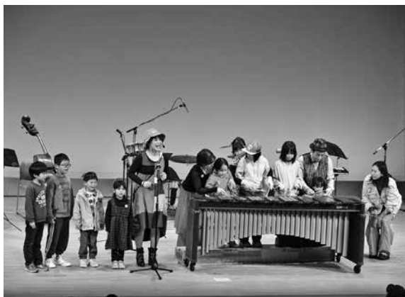
みんなで演奏体験♪

今回はさまざまな楽器を紹介し ながら使用し、みんなが知ってい る曲や色んな国で親しまれている 曲などの演奏が行われ、会場は世 界中を旅しているかのようなでし た。また、来場者もステージに上 がって一緒に楽器に触れ演奏を行 い、子どもたちも真剣な表情で興 味を持つ姿が伺えました。