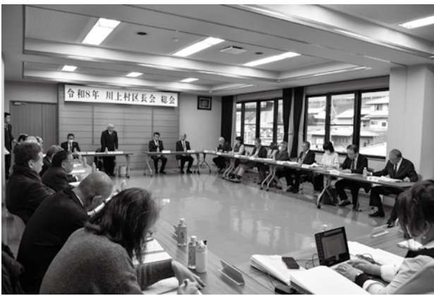
総会にて辰巳区長会長のあいさつ

区長の皆さんには、日ごろより地区の代表として村民と行政機関を繋いでご尽力いただくなど、さまざまな場面で活躍していただいております。今年も1年間、よろしくお願ひします。