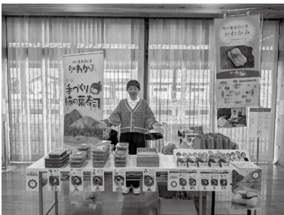
川上村の柿の葉寿司がずらっと！

今後の活動としましては、柿の葉寿司を含む数々の郷土料理を村内の皆さまとご一緒に伝承できるような集いを考えております。至らぬ点多々ありますが、是非その際はお力添えをいただきますと幸いです。