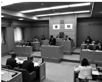
予算補正の議案説明

歳入歳出それぞれ9,434万5千円を増額し、予算総額は36億3,760万9千円となりました。これは、物価高対応子育て応援手当の支給、地域振興券の配布、昨年11月に発生した村道井光線の落石災害に伴う災害復旧事業の実施などが主な内容です。