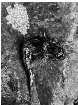
村内に生息するカジカ

吉野林業や山岳信仰など暮らしの中で森を利活用しながら守り続けてきたことが、希少な生きものの生息する河川環境の保全へつながっています。