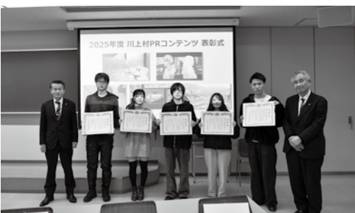
素晴らしい作品を制作された学生の皆さん

今回も学生たちが制作した90作品が集まりました。コンテンツには、「源流ツアーの紹介」「川上村に住みたくなる」「川上村に泊まりに行きたくなる」という村の想いを定めたテーマを定めており、資源や課題について学んで考え、ときに村を訪れて、それぞれの想像