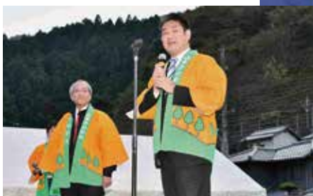
仲川げん奈良市長も応援に！