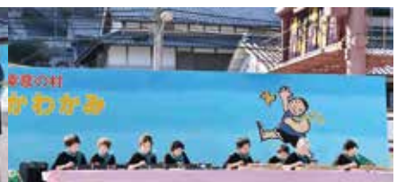
大正琴「はなみずき」