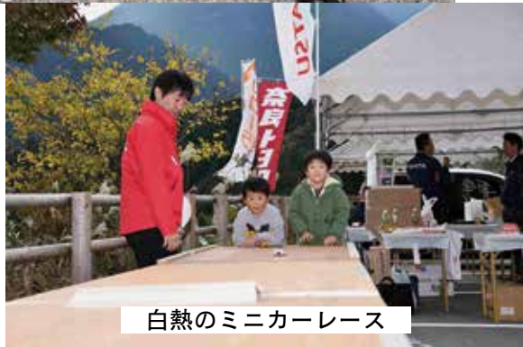
白熱のミニカーレース