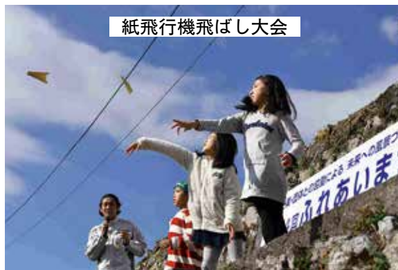
紙飛行機飛ばし大会