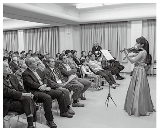
吉野杉バイオリンのコンサート

吉野かわかみ社中は、500年の歴史ある吉野林業を次の500年へつなぐことを理念として、平