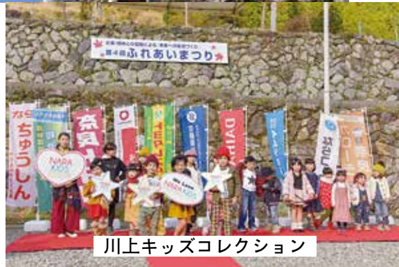
川上キッズコレクション