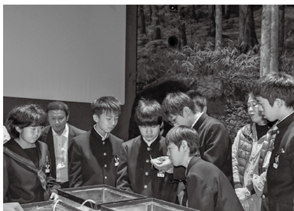
実際に手で触れて海を感じてもらいました

源 流の日を記念して、やまぶき保育園と川上小・中学校を対象に、海の生き物に関する授業が森と水の源流館で開催されました。 和歌山県立自然博物館の方を講師に迎え、移動水族館を展開して、ヒトデやウニ、マツカサウオなどの生き物を見て、手で触れて海の生態を学びました。第34回全国豊かな海づくり大会から4年が経過したこの日、子どもたちは海を感じることで、海とつながる水源地の役割を考え、その重要性を認識したのではないのでしょうか。