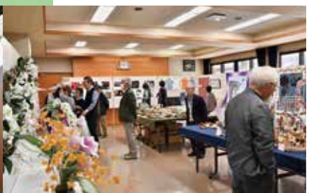
作品はどれも力作ばかり