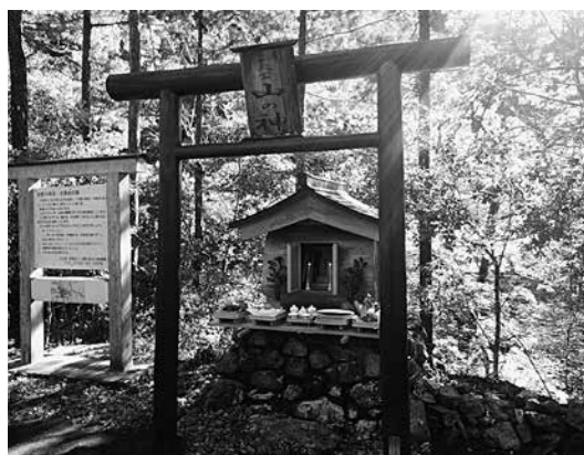
山の神のお祭りを行いました

生物圏計画」に基づく生物圏保存地域(国内呼称…ユネスコエコパーク)の緩衝地域、文化庁が認定する日本遺産「吉野」の構成要素に認定されています。村有林として、保全を第一に進めながら、自然と人間社会のつながりの大切さを学習するための学習、研修、エコツーリズムを推進していく場として活用されています。 水源地の森を案内する私たち