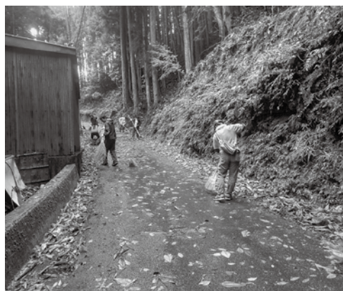
伯母谷区での清掃作業

関 西電力労働組合と川上村は平成24年に「森林保全活動に関する協定書」を締結し、森林環境保全を進め、伐採された天然林の再生に取り組んでいます。今年は相次ぐ台風の被害のため、電気設備等の復旧作業が管内でいまだ続く忙しい中、11月9日〜10日に21人の方が川上村へボランティアに来てくれました。 台風の影響で「関労かわかみの森」での作業はできませんでしたが、地区の清掃や人工林の間伐を行い、参加者の皆さんは「川上村の役に立てて、喜んでもらえて良かった」「森の大切さを感じられた」と話してくれました。