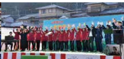
コーラスグループ「華音」