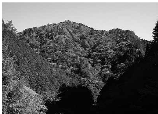
「山の神の日」を祝うかのように紅葉がピークを迎えた水源地の森

11月3日は今年最後の水源地の森ツアー。また10日は関西電力労働組合さん、17日は和歌山市民の森づくり源流体験学習会で「吉野川源流―水源地の森」を案内させていただきました。急な冷え込みで、一気に紅葉が進んだため、いずれの日も美しい紅葉をお楽しみいただきました。 「吉野川源流―水源地の森」は2016年にユネスコの「人間と