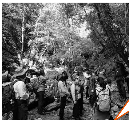
水源地の森ツアーの様子

も、川上村の自然と人のつながりを理解すべく調査・研究や環境に関連する情報収集等を行っています。参加者のみなさんが、環境、特に源流域の大切さに感動し、行動化できるような案内ができるように研鑽 けんさん を続けています。日本遺産の構成要素「山の神の信仰」を大切に、お祭りを続けていくのも、その行動の一つです。今年も多くの皆さんに当館のイベントなどにご参加いただきました。川上村に関わるみなさんに感動を与えられた一年となっていれば幸いです。来年も感動を届けられるように頑張っていきたいと思っています。