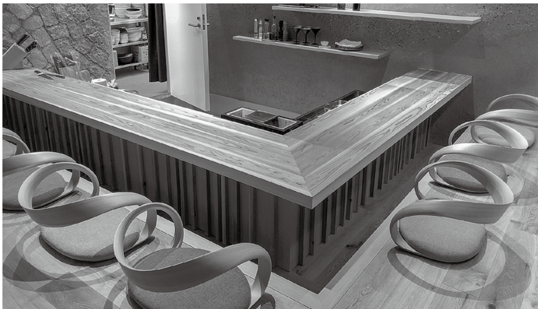
ホテル「セトレならまち」のレストランに納入させていただきました