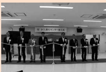
竣工式典に出席した栗山村長