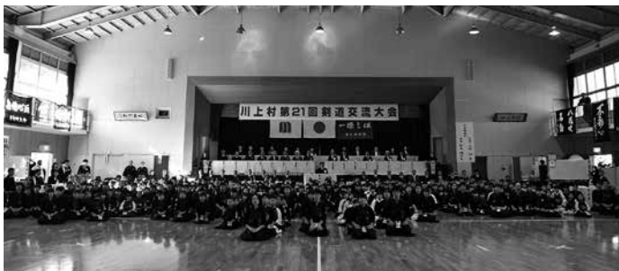
400名を超える参加者がありました