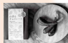
山香るチョコレート