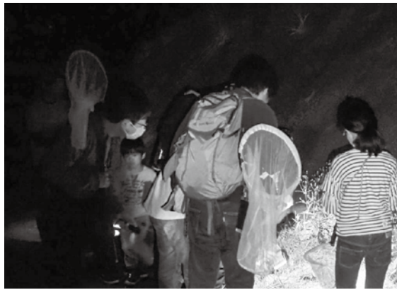
動物の痕跡を探しました

9・10月実施の体験プログラム 9月23日「ナイトウォーク・夜の探検隊」暗闇に潜む生き物を探そう！