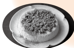
波津茶のチーズケーキ

商品は焼き加減や味・食感の試作を何百回も重ねてきました。その中でも大和茶チーズケーキは東川波津の茶畑で採れたものを使用しております。お子様にも食べていただけるように粉末は別添えです。包装は上品に仕上げ、贈り物としてご注文頂くことも増え、この場をお借りして感謝申し上げます。※大和茶チーズケーキはホテル杉の湯売店でのみ購入できます。