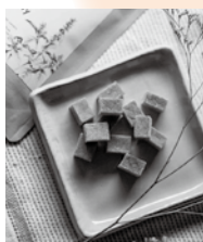
トゥルシー ヴィーガンゼリー

インドの伝承医学において、不老不死の霊薬と言われる万能ハーブ「トゥルシー(ホーリーバジル)」。そのトゥルシーを川上村中奥で育て「源流の村から世界へ～体にも心にもよいものを」をコンセプトにトゥルシーを練り込んだヴィーガンゼリーを作り出しました。やさしい甘さと、さわやかな香り、癒やしのひとときをどうぞ。