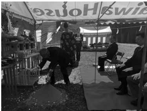
地鎮の儀 鎌で刈る栗山村長