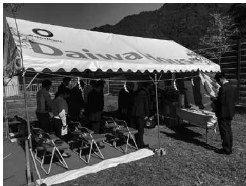
参列者全員で工事の安全を祈願しました

白川渡ふれあい住宅建設工事は、事業費約1億9百万円で竣工は令和6年3月を予定しています。単身向け4戸と夫婦世帯向け2戸からなる2階建て長屋住宅として、村内定住者の増加に期待されています。