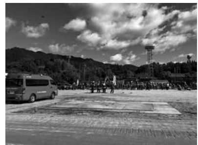
多くの団体が集まり訓練が行われました

10月22日（日）、吉野運動公園にて「奈良県防災総合訓練」が実施されました。この訓練は奈良県が主催となり、防災関係機関等の連携体制の強化及び住民の防災意識の高揚を目的に県内各地で開催されています。