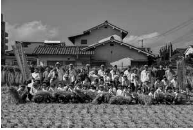
源流から流れ着いた水で育った稲をたくさん刈りました

この日に刈り取ったお米は本村に贈呈され、給食として提供されます。この体験を通し、両校の児童が水のつながりや豊かな水資源の大切さを少しでも認識して、それを期待します。