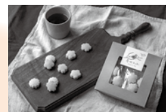
薬味クッキー (山椒・一味・プレーン) 3種類

村の特産品を作る…「村にあるもの？いつももらっている山椒、一味をクッキーの生地に入れてみては？」の発想から始めました。苦手な方でも食べられるクッキーに仕上げています。匠の聚とホラ！あなさんとドリンクと一緒に食べることができますので、一度食べてみてください。