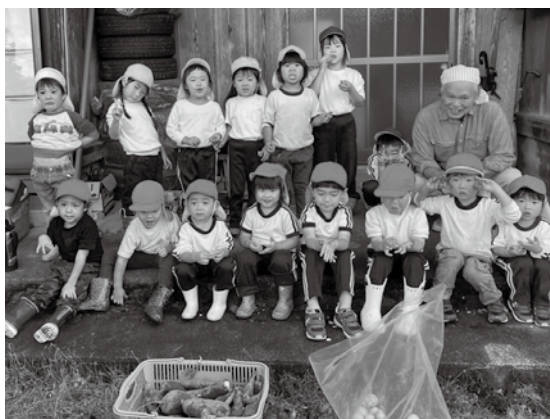
お芋いっぱいとれたよ!

と力比べをする子や、「お芋を見つけるぞ!」と一生懸命掘る姿がありました。「出てきた! 大きいよ!」と歓声があちらこちらからあがり、大きいお芋や小さいお芋をたくさん収穫することができました。帰りにはみかんの収穫もさせてもらい、みんなで食べて、秋の楽しい時間を過ごすことができました。とれたお芋は、11月に焼き芋パーティーをする予定です。