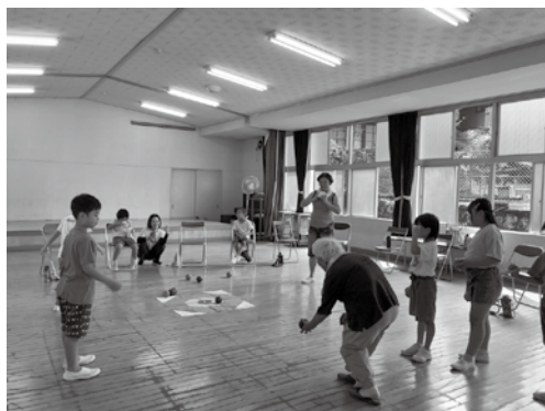
世代を超えたボッチャ大会!