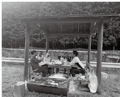
上多古の東屋にて