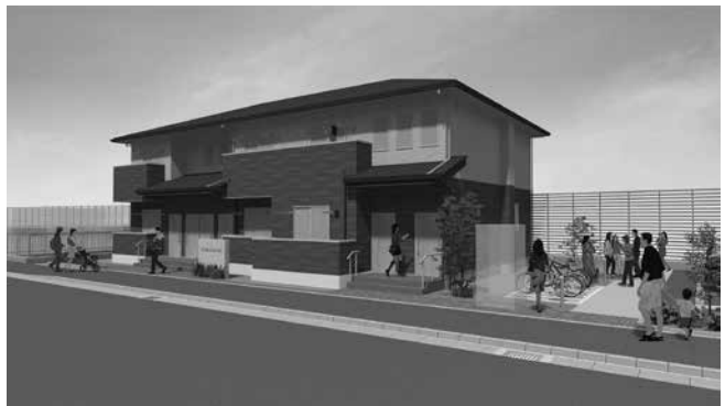
白川渡ふれあい住宅完成予定図