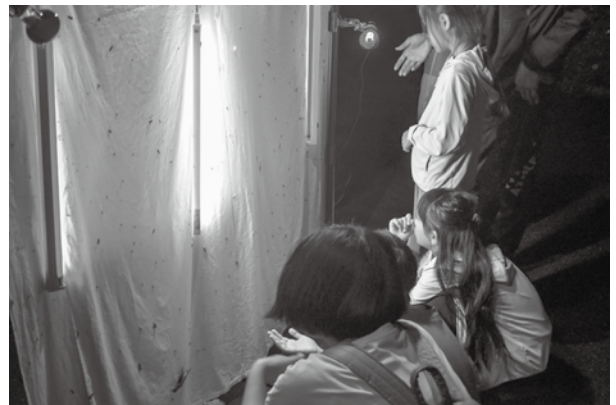
ライトトラップに集まる虫を観察しました

いよいよライトトラップに集まる虫を観察に。大きなヤママユ蛾がいました！「大型の蛾が集まってくれて、大変見応えがありました」との声をいただきました。