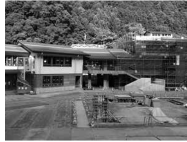
運動場から見た現在の源流学園

建物を覆っていた外部足場もそのほとんどが撤去され、園舎や校舎の全体が見えてきました。2階部分はすでに外壁が完成していますが、1階部分に新たに施行されているのは杉板の下見板で、壁に降った雨水の浸透を防ぐことで外壁の痛みを軽減する効果があるようです。川上産の杉板約2,400枚が使用され、外部にも「木」をふんだんに用いています。今後は、内・外装工事に加え、運動場整備にも着手していきます。そのため、現在運動場内に設置の現場事務所をしばらくら会館