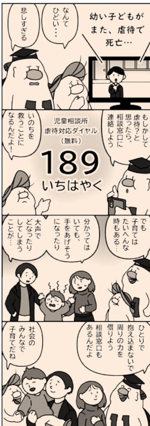
(川上村人権・同和問題啓発活動推進本部)