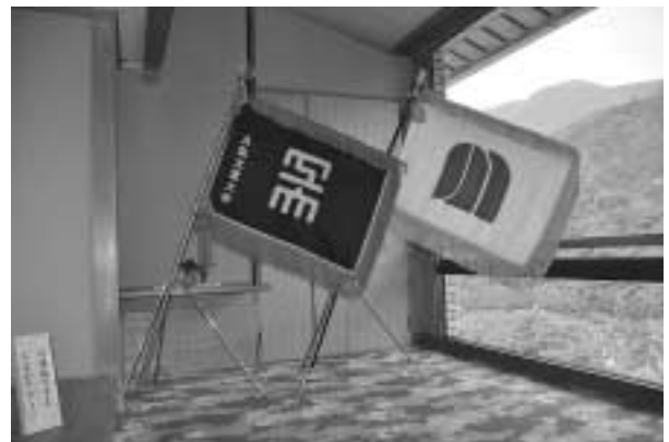
調印式に臨み並べられた大阪工業大学旗と川上村旗

取り組みを行う同大学から、村は自治体としても多くの事柄を学んでいきたいと考えています。